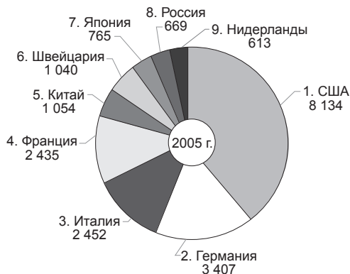
Рис. 3. Золотой запас в государственных резервах некоторых стран

По сведениям МВФ, с января по сентябрь 2011 г. больше всех к своим золотым резервам добавила Мексика — нетто 83,7 т, за ней следует Россия — 59,3 т, затем Таиланд — 52,9 т. Оценочно, к 1 ноября 2011 г. Россия увеличила свои запасы золота до 880 т (рис. 3).