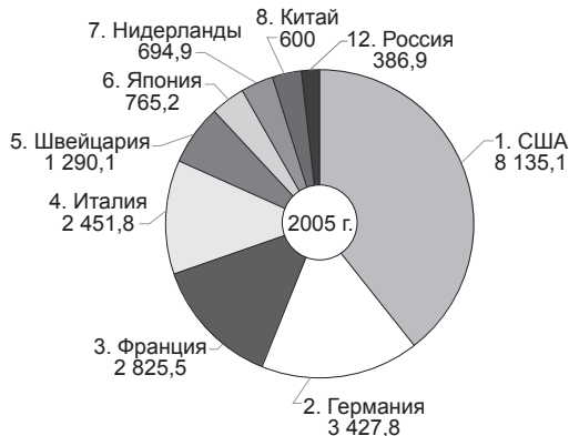
Рис. 2. Первые 12 стран с крупнейшими запасами золота, т (по данным Всемирного золотого совета)

По сведениям МВФ, с января по сентябрь 2011 г. больше всех к своим золотым резервам добавила Мексика — нетто 83,7 т, за ней следует Россия — 59,3 т, затем Таиланд — 52,9 т. Оценочно, к 1 ноября 2011 г. Россия увеличила свои запасы золота до 880 т (рис. 3).